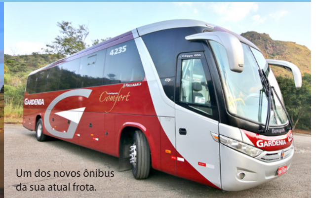
Um dos novos ônibus da sua atual frota.