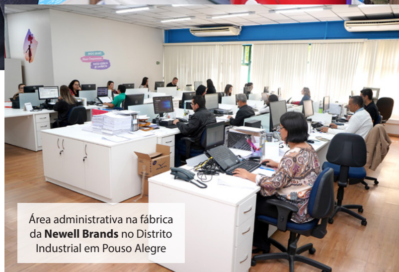
Área administrativa na fábrica da Newell Brands no Distrito Industrial em Pouso Alegre