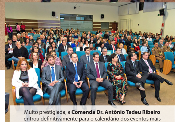
Muito prestigiada, a Comenda Dr. Antônio Tadeu Ribeiro entrou definitivamente para o calendário dos eventos mais prestigiados e importantes de Pouso Alegre-MG . Uma justa homenagem a todos que contribuem para o Direito na Região