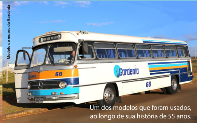
Um dos modelos que foram usados, ao longo de sua história de 55 anos.