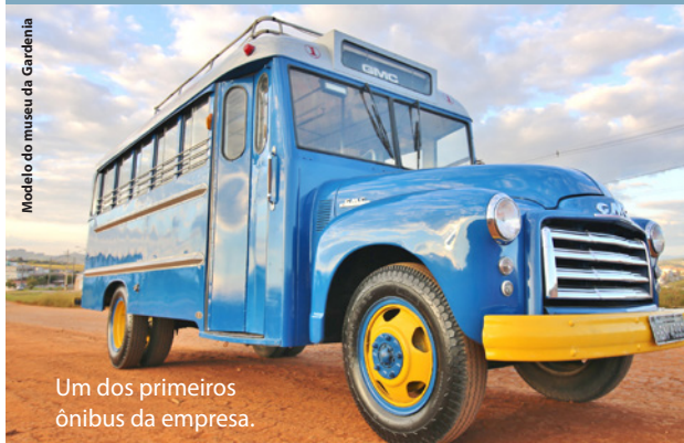
Um dos primeiros ônibus da empresa.

Há 55 anos, transportando: pessoas, cargas e encomendas, a Expresso Gardenia anuncia início de uma nova fase de investimentos.