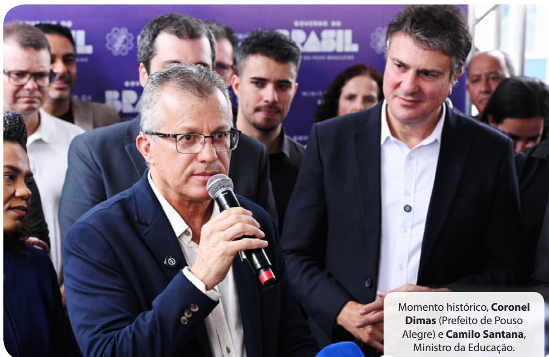
Momento histórico, Coronel Dimas (Prefeito de Pouso Alegre) e Camilo Santana , Ministro da Educação.

Durante o ato, o Prefeito Coronel Dimas enfatizou o legado educacional para as famílias da cidade. Para o Prefeito, “a concretização deste campus permite que o cidadão de Pouso Alegre tenha um ciclo completo de formação. Hoje celebramos a vitória de um planejamento sério. Uma criança que entra hoje em um de nossos Centros de Educação Infantil sabe que tem o caminho aberto para se formar em uma das maiores universidades federais do país sem sair de sua cidade. É a educação transformando gerações” . O Vice-Prefeito Igor Tavares destacou a convergência entre o ensino e o setor produtivo. “A chegada da