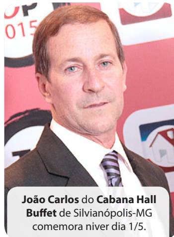
João Carlos do Cabana Hall Buffet de Silvianópolis-MG comemora niver dia 1/5.