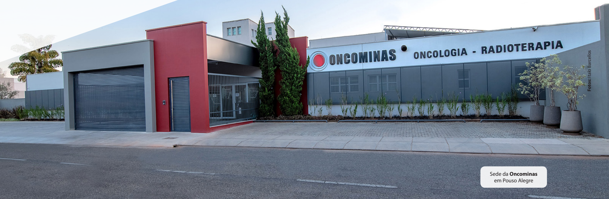
Sede da Oncominas em Pouso Alegre

Um legado de 30 anos de Trabalho pela Vida no Sul de Minas, construído com inovação e excelência.