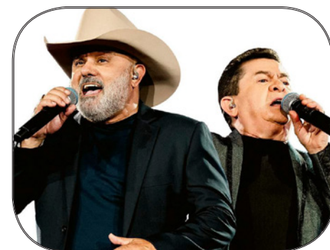
Rio Negro e Solimões