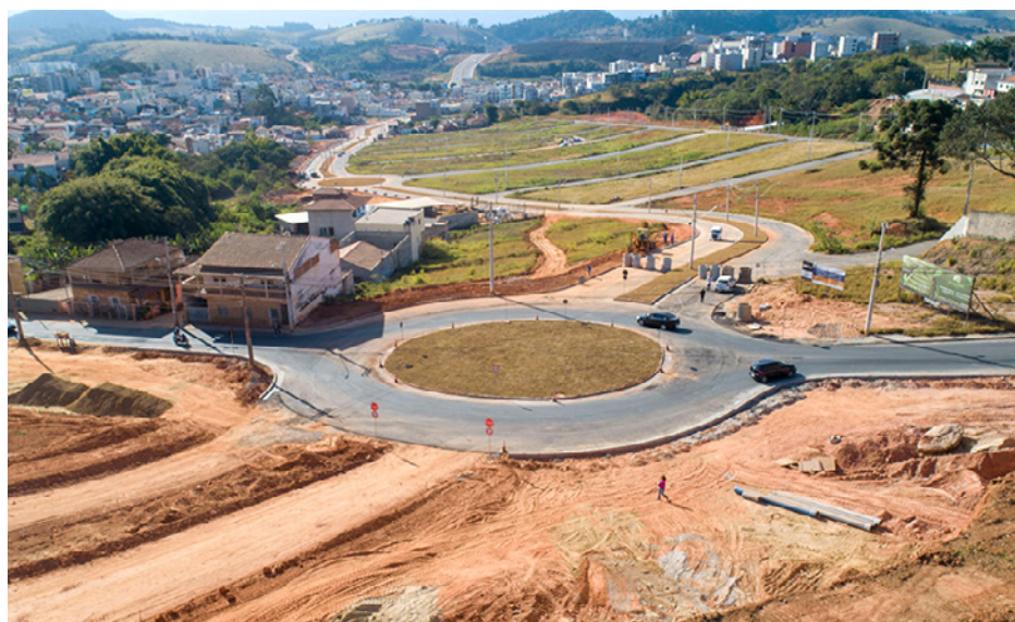
Texto/Foto: ASCOM da Prefeitura de PA.

As obras de drenagem e pavimentação entre a Avenida Noroeste e a rua Alberto Paciulli estão sendo realizadas em ritmo avançado. No momento, a empresa responsável pelo serviço, RDA Construções , está empenhada na estrutura da nova rotatória da Alberto Paciulli, que já está sendo utilizada e facilitando o trânsito no local.