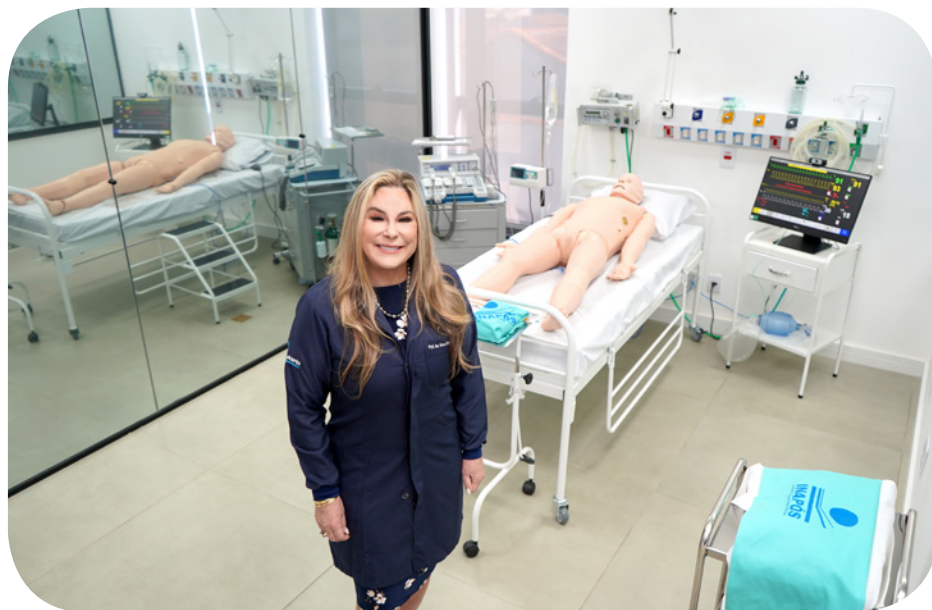
Infraestrutura, ampla e moderna para simulação de práticas médicas