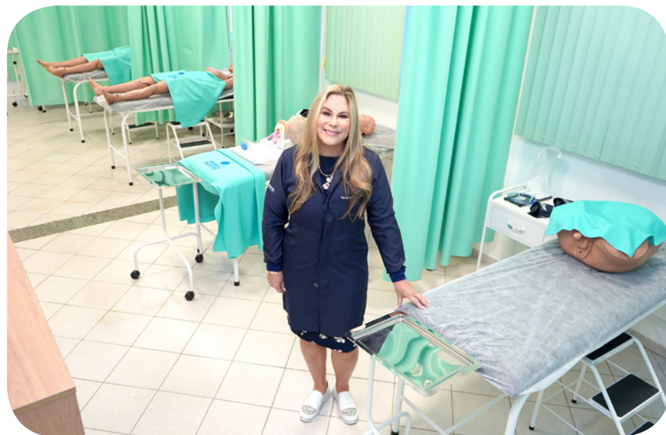
Avaliação máxima no MEC, professores 100% doutores e/ou mestres