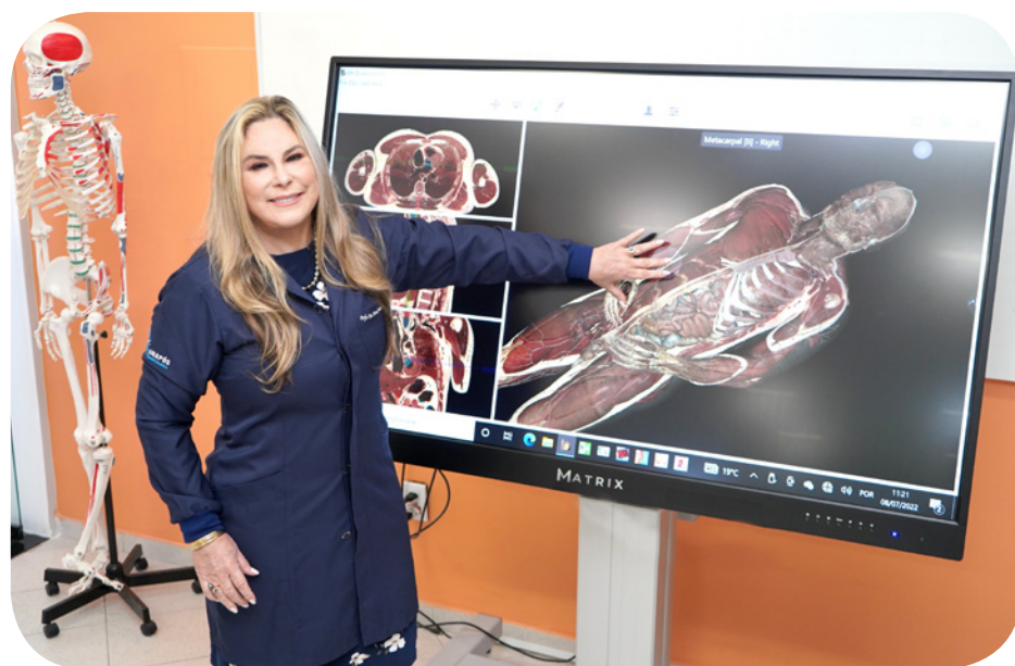
Equipamento simulador médico de última geração