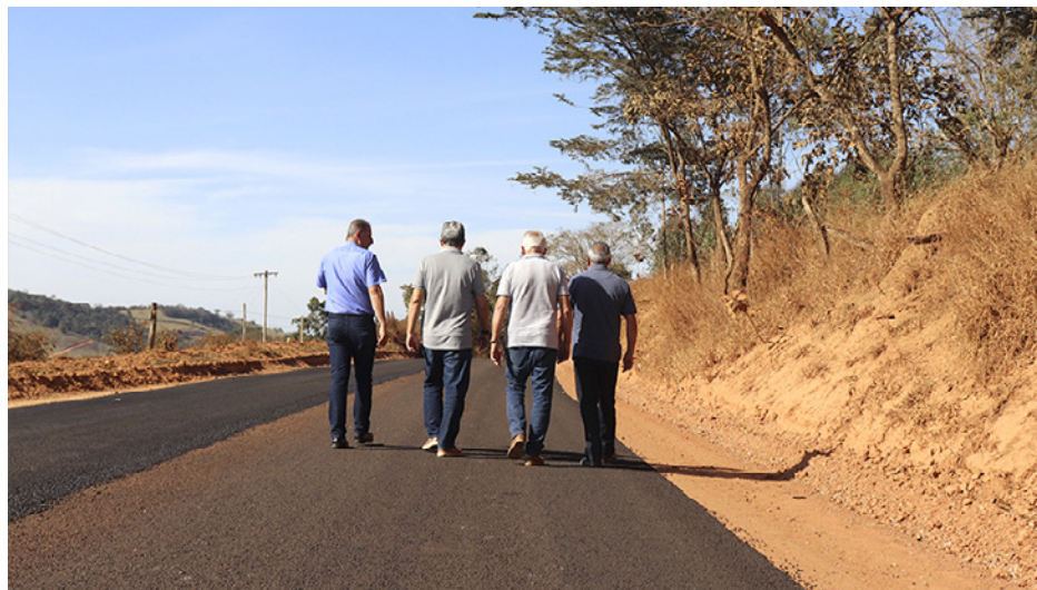
Texto/Foto: ASCOM da Prefeitura de PA.

A Prefeitura de Pouso Alegre deu início à fase de pavimentação da estrada que liga os bairros Faisqueira, Cristal e Brejal . Anteriormente, no local foram retirados mais de 40 caminhões de terra preta que dificultava o andamento das obras.