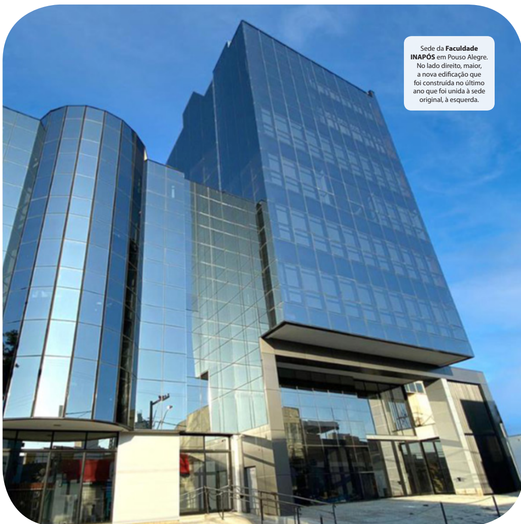
Sede da Faculdade INAPÓS em Pouso Alegre. No lado direito, maior, a nova edificação que foi construída no último ano que foi unida à sede original, à esquerda.