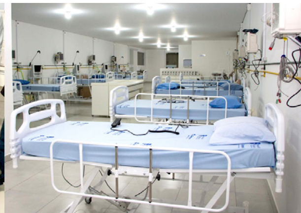
Foto dos novos leitos de UTI