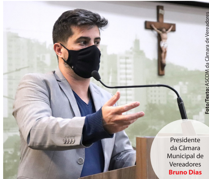
Presidente da Câmara Municipal de Vereadores Bruno Dias

Um exemplo de boa administração! Assim foi o término dos primeiros cinco meses do ano de 2021 para a Câmara Municipal de Pouso Alegre . A casa de leis realizou na última semana, a entrega de um valor de R$ 500 mil à Prefeitura , referente ao saldo remanescente da verba que a Câmara recebe do executivo. Contando com o valor já devolvido nos meses anteriores, o total em 2021 já alcança os R$5 milhões de reais.