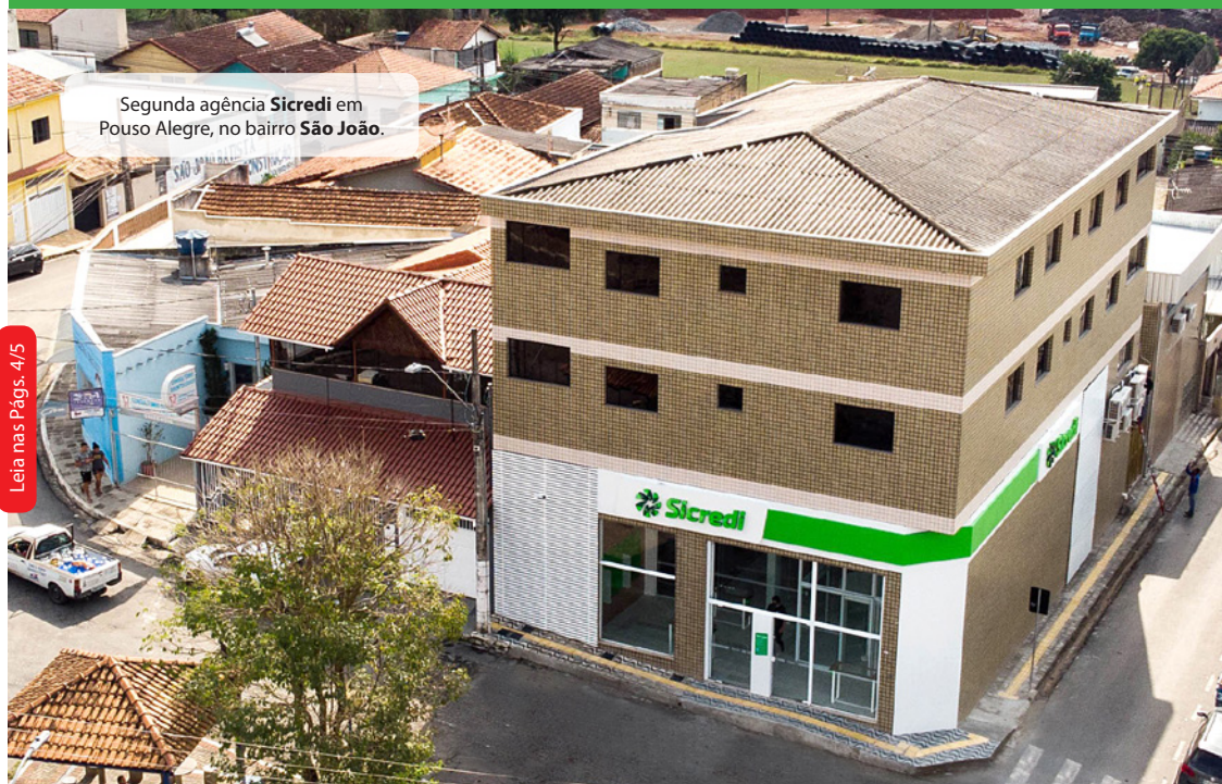
Segunda agência Sicredi em Pouso Alegre, no bairro São João.

Instalada no bairro São João, a segunda agência no município foi inaugurada na sexta-feira, 4, com a presença de lideranças locais e de representantes da Cooperativa