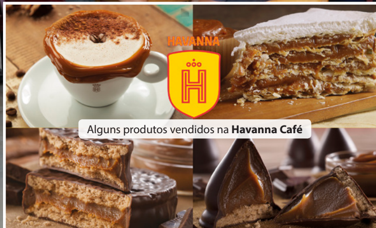
Alguns produtos vendidos na Havanna Café