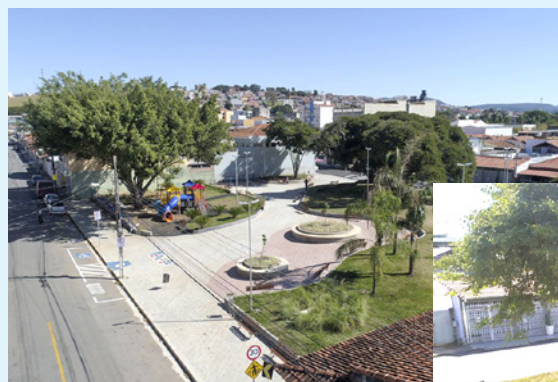
Vista aérea da Praça da Árvore Grande, no Bairro Árvore Grande em Pouso Alegre.