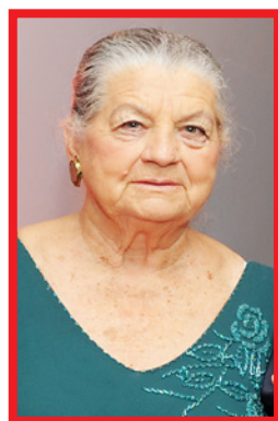
Fazer o Bem Faz Bem