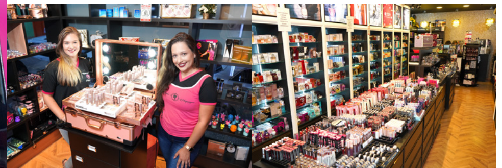
A loja mais cheirosa de Pouso Alegre!