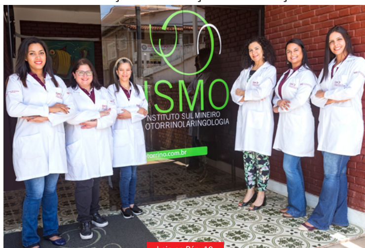
Leia na Pág. 10

CLÍNICA ISMO: Excelência em Otorrinolaringologia, Centro de Implante Coclear e Núcleo de Avaliação da Audição da Criança.