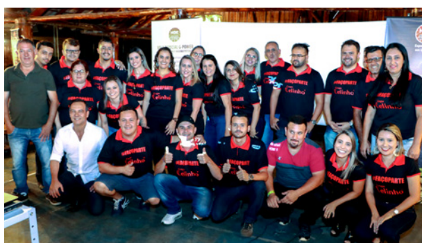
Equipe do Celinho de Pouso Alegre-MG

Texto: Dias News - Fotos: Lidiane (Marketing do Celinho).