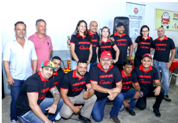
Equipe do Celinho de Itajubá-MG