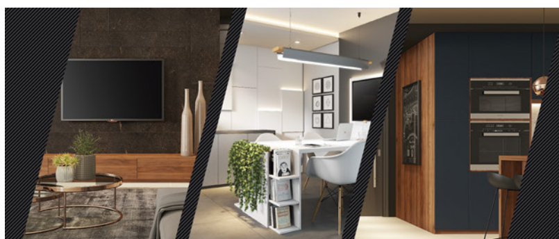
Leia nas Págs. 4 e 5

Novas cores e padrões. Novas possibilidades.