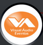
Foto e Vídeo