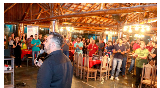
Imagem do evento em Itajubá-MG