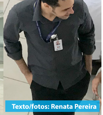
Texto/fotos: Renata Pereira

Implantes para você sorrir sem moderação.