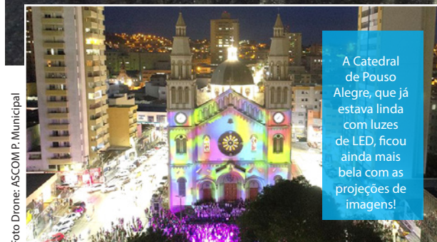
A Catedral de Pouso Alegre, que já estava linda com luzes de LED, ficou ainda mais bela com as projeções de imagens!