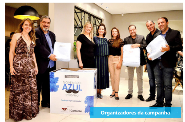
Organizadores da campanha