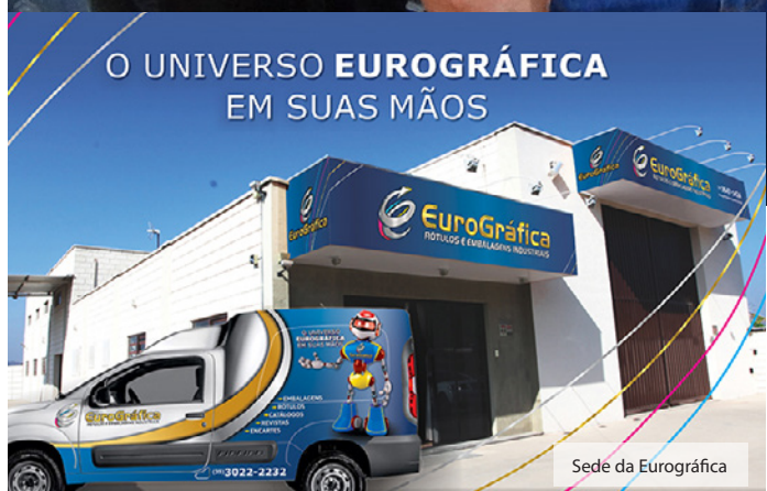
O UNIVERSO EUROGRÁFICA EM SUAS MÃOS

Outra inovação que a Eurográfica traz para o mercado, é que se o cliente necessitar, ele leva sua ideia, que a área de criação da gráfica faz a arte para ser impressa. A empresa está localizada em Pouso Alegre-MG, na saída para Borda da Mata-MG, telefones: (35) 3647-1424, (35) 3022-2232 ou WhatsApp: (35) 9 9871-8765. e-mail: comercial@eurografica.com.br ou eurografica@eurografica.com.br