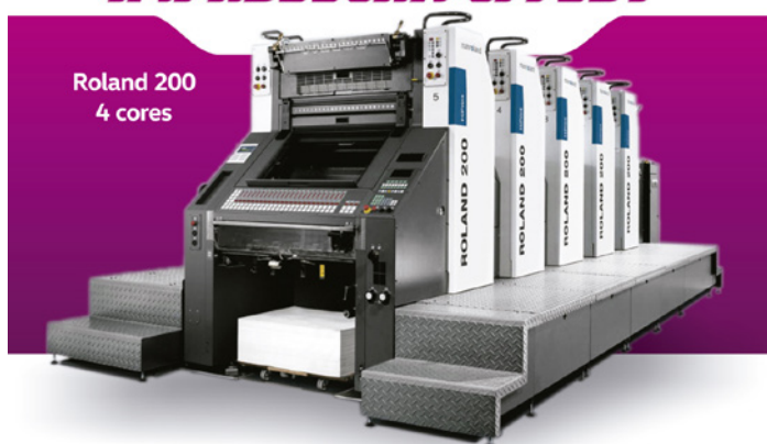
Roland 200 4 cores