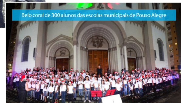
Belo coral de 300 alunos das escolas municipais de Pouso Alegre