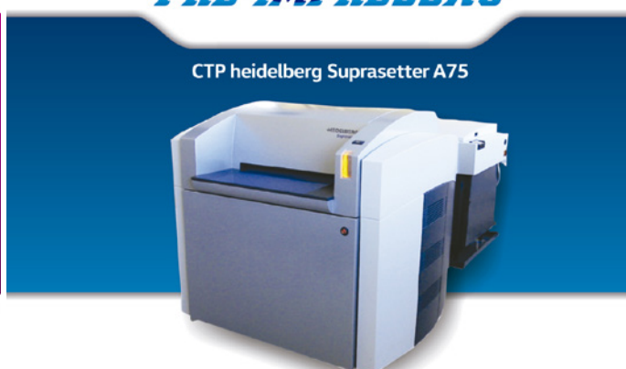
CTP heidelberg Suprasetter A75

Fotos/Texto: Italo Barcellos e Luiza Dias