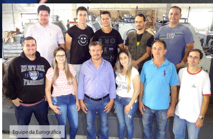
Equipe da Eurográfica