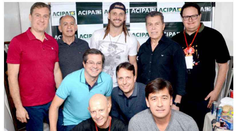
A competente diretoria da Acipa com o líder/vocalista do Falamansa . Depois de arrumar os pilares da Acipa, estão mostrando seus inovadores projetos!

*** Este espacinho ficou pequeno para o Ninguém Merece mais relevante da quinzena, que foi o atentado terrorista contra o Bolsonaro . Então, o jornal se manifestou em editorial na página 2. E ainda tem gente que justifica falando que o Bolsonaro é que estava errado em ter ficado no meio do povo. Mas gente, em que País estamos? Onde não podemos mais andar na rua porque um lunático pode vir e te esfaquir pelo que você pensa ou deixa de ser, cadê o Estado Democrático de Direito ?