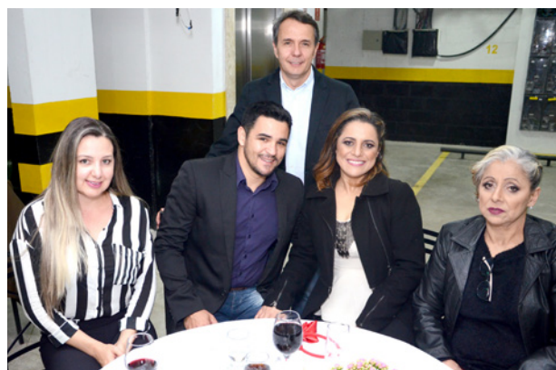
Convidados e investidores do Med Center Vital Brazil