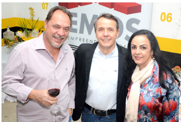
Convidados especiais do Med Center Vital Brazil