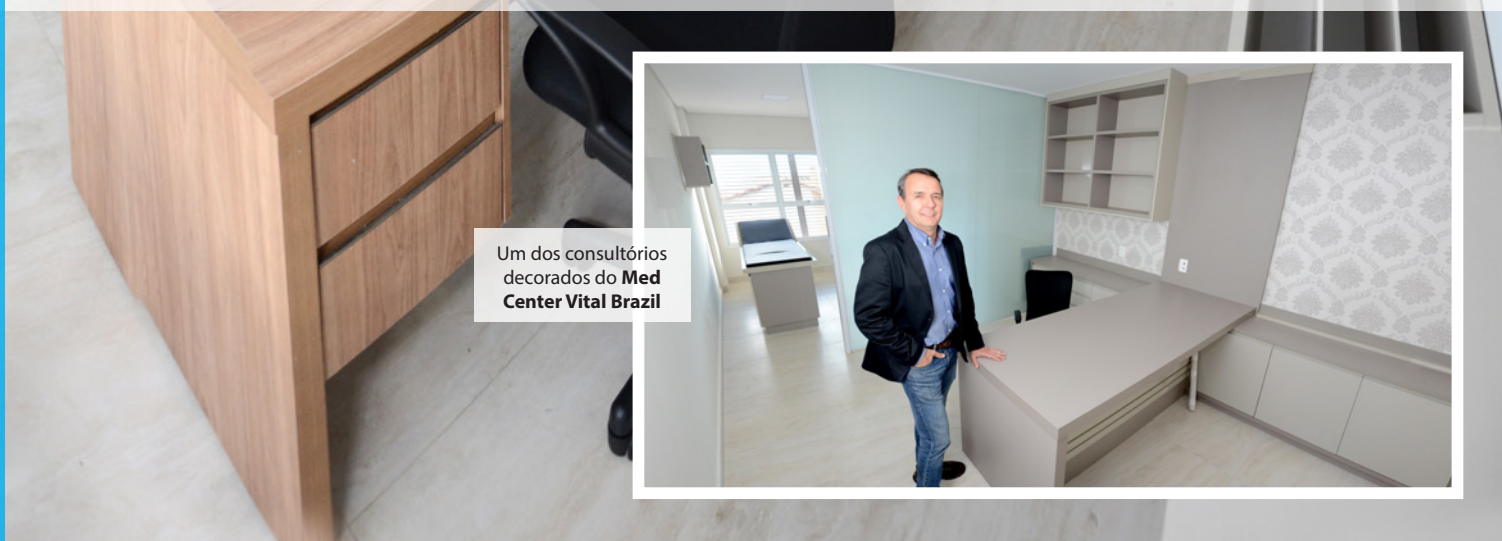
Um dos consultórios decorados do Med Center Vital Brazil

Ao entregar seu primeiro empreendimento, empresa se prepara para lançar um “GIGANTE DA SAÚDE”, na frente do espaço onde era o Ceasa de Pouso Alegre