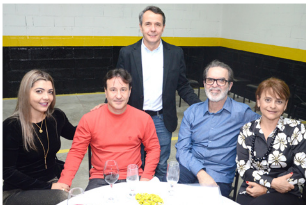
Convidados e investidores do Med Center Vital Brazil