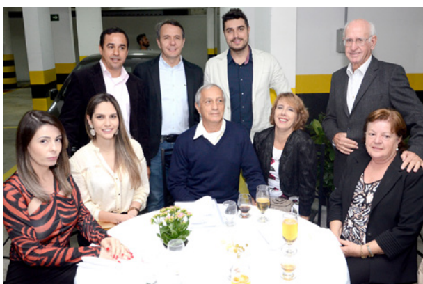
Convidados e investidores do Med Center Vital Brazil