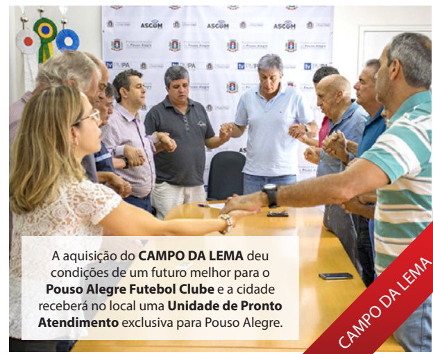
A aquisição do CAMPO DA LEMA deu condições de um futuro melhor para o Pouso Alegre Futebol Clube e a cidade receberá no local uma Unidade de Pronto Atendimento exclusiva para Pouso Alegre.