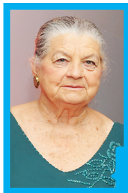
Fazer o Bem Faz Bem!

Se você necessita de transporte médico ou possui algum familiar acamado, entre em contato conosco e saiba mais sobre o serviço de remoção.