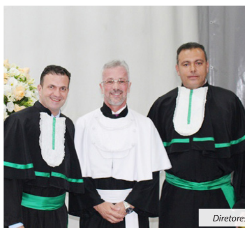
Diretores e vice-reitores da UNIVÁS que foram empossados.