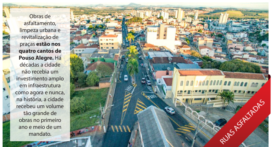
Obras de asfaltamento, limpeza urbana e revitalização de praças estão nos quatro cantos de Pouso Alegre . Há décadas a cidade não recebia um investimento amplo em infraestrutura como agora e nunca, na história, a cidade recebeu um volume tão grande de obras no primeiro ano e meio de um mandato.