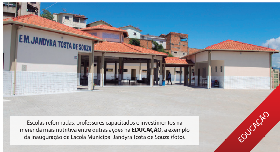
Escolas reformadas, professores capacitados e investimentos na merenda mais nutritiva entre outras ações na EDUCAÇÃO , a exemplo da inauguração da Escola Municipal Jandyra Tosta de Souza (foto).