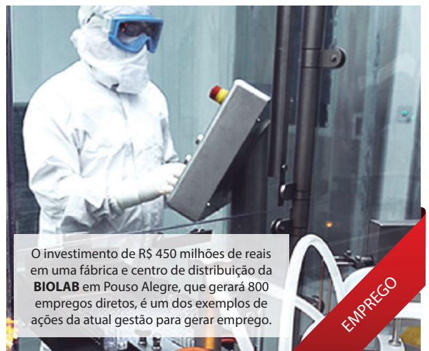
O investimento de R$ 450 milhões de reais em uma fábrica e centro de distribuição da BIOLAB em Pouso Alegre, que gerará 800 empregos diretos, é um dos exemplos de ações da atual gestão para gerar emprego.