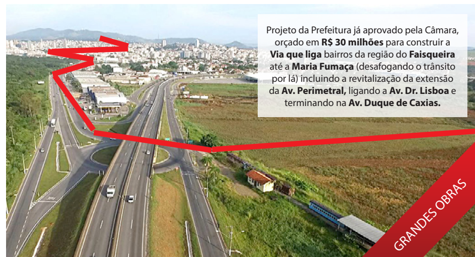
Projeto da Prefeitura já aprovado pela Câmara, orçado em R$ 30 milhões para construir a Via que liga bairros da região do Faisqueira até a Maria Fumaça (desafogando o trânsito por lá) incluindo a revitalização da extensão da Av. Perimetral , ligando a Av. Dr. Lisboa e terminando na Av. Duque de Caxias .