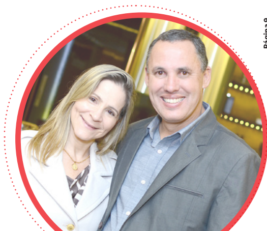
Dalmóobile agora em Pouso Alegre