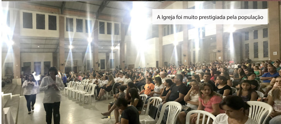
A Igreja foi muito prestigiada pela população