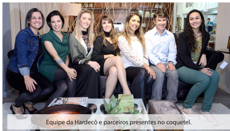
Equipe da Hardecô e parceiros presentes no coquetel.

A Jares Móveis de Pouso Alegre fica na Rua Comendador José Garcia, 688 . Visite o site da Jares : www.jaresmoveis.com.br