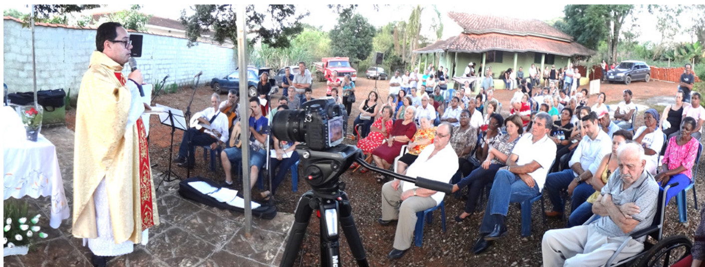
Parte dos presentes na Missa que contou com a presença da comunidade do Pantano e de bairros de Pouso Alegre.