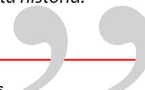
Foto e texto: ASCOM FAI - Mais informações e imagens sobre os 45 anos da FAI , acesse o site: www.fai-mg.br e a fanpage: Facebook.com/Fai Ensino Superior

Quarenta e cinco anos se passaram e a FAImília cresceu. Hoje somos cinco cursos de graduação, onze cursos de pós-graduação, mil e duzentos alunos, noventa professores e cinquenta colaboradores. Já formamos mais de três mil e quinhentos profissionais, contribuindo para o APL Eletroeletrônico de Santa Rita do Sapucaí e para o desenvolvimento de Minas Gerais e do Brasil. Com a missão de formar empreendedores para o mercado e cidadãos responsáveis para a sociedade, temos criado inúmeras oportunidades para conscientizar nossos alunos e inseri-los como profissionais mais humanizados e conscientes na sociedade onde atuam. Nós crescemos, mas a essência da instituição permanece viva representada por aqueles que fizeram e ainda fazem parte desta história.