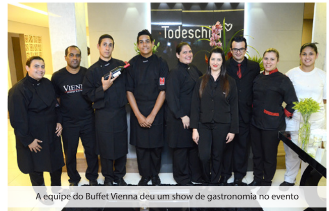
A equipe do Buffet Vienna deu um show de gastronomia no evento