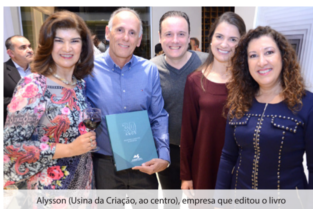
Alysson (Usina da Criação, ao centro), empresa que editou o livro